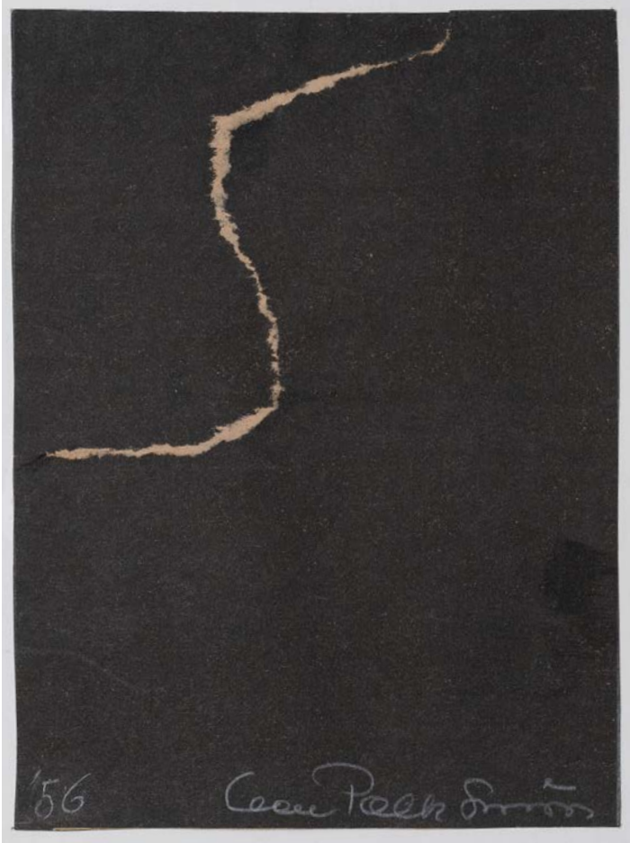
oben: torn drawing, 1956, 12x9 cm, OP15 unten: o.t., 1962, 76 x 57 cm o.t., 1964, 101,5 x 66 x 5 cm o.t., collage-zeichnung, 1970, 107,5 x 76,5 cm