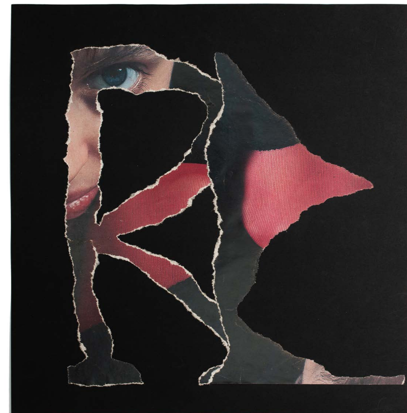
links oben: knöchel des alphabets, blatt 28, 29, 17, 22, 1989, je 28 x 28 cm links unten: vertrauen ist besser, 1993, 42 x 29,7 cm mitte oben: a-quadrat, die andere version, 1993, 42 x 29,7 cm mitte unten: h wie heute, 1985, 65 x 46 cm rechts: die fahne im wind, 1988, 35 x 34 cm