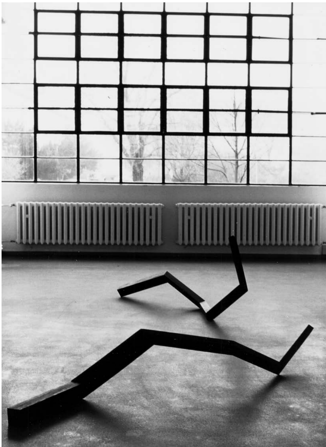
ausstellung im bauhaus dessau, d, 1998

the fascinating dialogue between these two artists within the exhibition—still visible in the photo (...)—is constituted by their contrasting attitude towards the principle of chance. morellet lets chance be chance—his basic grids are there, just to provide randomness with an optimal space to show itself; chance determines the resulting image as much as possible. dilworth does not use chance at all, but the works strongly suggest that chance played an important role. this has to do with one of the core aspects of the generation concept: dilworth makes systematic choices in how to link units, one may say: how to let the units of the work grow and develop out of each other. the result gives the impression of chance, because there are many possibilities that dilworth did not use—although he could use them in a work that would constitute a next member of the same family of works, of the same generation. exactly that constitutes the double meaning of the concept of generation: each work is generated as one possible realisation of the sculptural genes within the abstract rule or the concrete unit that is used; and a series of works in which these genes are differently realised throughout, is also a generation in the true sense of the word.