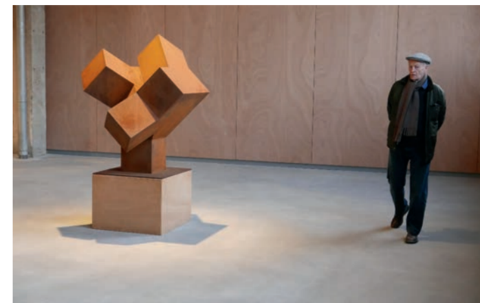
links oben: crossing, 2014, corten-stahl, 100 x 100 cm links unten: three on three, 2016, corten-stahl, stahl, weiße farbe, 106 x 86 x 86 cm mitte oben: norman dilworth und adelheid hoffmann, 2012, friedberg/hessen, d mitte unten: equal volumes, 2014, corten-stahl, 240 x 170 cm oben: spirit, 2001, corten-stahl, 350 x 280 cm rechts: norman dilworth mit skulptur 4 x 2,5 n° 8, 2016, amilly, f