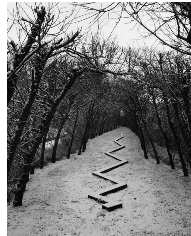
mäander, galerie de ziener, asse, b, 2018

2018 art karlsruhe with galerie oniris, rennes, f, and galerie gimpel & müller, paris, f art paris with galerie gimpel & müller, paris, f, galerie oniris, rennes, f, galerie wagner, le touquet, f art brussels, exhibition françois morellet, norman dilworth, vera molnar with galerie oniris, rennes, f art cologne with galerie hoffmann, friedberg/hessen, d